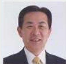
日高市長 谷ヶ崎 照雄